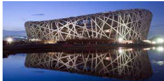
"Le nid d'oiseau", 2008 (Beijing, Chine)