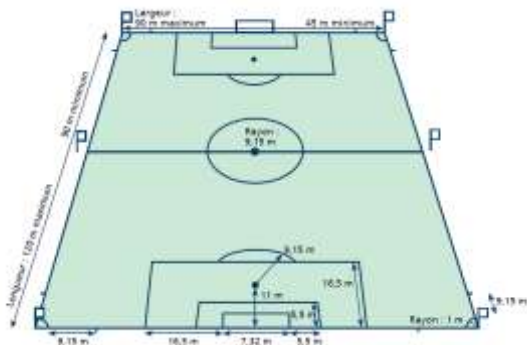
Le terrain de football (Fifa)

Le développement des sports et leur médiatisation vont pousser les stades à se spécialiser. Ils vont être marqués par la présence d'un club y jouant « à domicile ». Cependant, les grands événements (et en particulier les compétitions internationales de football) vont contraindre les stades à se rénover et à évoluer en fonction des