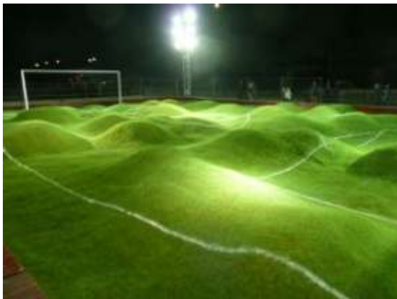
Priscilla Monge, Untitled, 2006

Le stade, et en particulier le stade de football, est à la fois un « lieu attribut » représentant un territoire et un « lieu de condensation », donnant un sentiment d'appartenance à une population (Debardieux, 1995). Cet équipement sportif, encore fortement lié à sa fonction et au temps de spectacle qu'il accueille en son sein, est aujourd'hui rarement protégé au titre des Monuments Historiques (seuls 4 stades, dont celui planifié par Le Corbusier à Firminy). De même, rares sont les équipements sportifs requalifiés (La Piscine de Roubaix) comme peuvent l'être des espaces industriels.