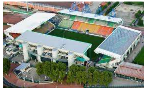
Stade Geoffroy-Guichard, 1984 (Saint-Etienne)

Mais elle n'est pas unique. Le stade « à l'anglaise », rare en France, est caractérisé par sa forme rectangulaire : un terrain encadré de tribunes indépendantes plus proches de l'action de jeu.