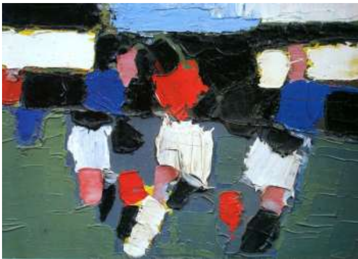
Nicolas de Staël, Le Parc des Princes, 1952

Le mot «stade» qualifie un terrain pourvu des installations nécessaires à la pratique sportive et généralement à l'accueil des spectateurs ( Larousse ). Mais à l'origine, ce terme désignait dans la Grèce antique une unité de mesure correspondant à 600 pieds (environ 183 m). Par la suite, le stade va devenir une enceinte sportive où se déroulaient des épreuves d'athlétisme comme la course à pied.