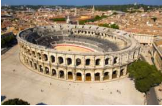
Amphithéâtre, 1 er siècle (Nîmes)

L'architecture des stades actuels s'inspire cependant bien plus des amphithéâtres romains dans lesquels les gladiateurs s'affrontaient. L'arène entourée de gradins elliptiques est désormais un terrain encadré de tribunes.