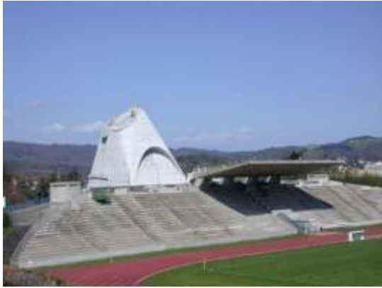
Stade de Firminy-Vert